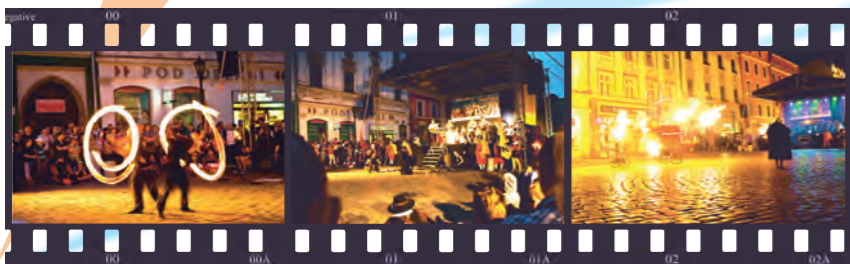
Czeska Świdnica-Sylwia Śliwa

W bieżącym roku w ramach konkursu fotograficznego „Dolny Śląsk w Unii Europejskiej” poprosiliśmy o przesłanie zdjęć, które zilustrują m.in. wydarzenia, obiekty odnowione lub unowocześnione dzięki finansowaniu ze środków unijnych lub sylwetki ludzi, którzy wzięli udział w projektach współfinansowanych z Europejskiego Funduszu Społecznego.